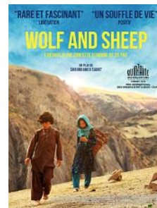
Wolf and Sheep , de Shahrbanoo Sadat (sortie en France le 30 novembre)